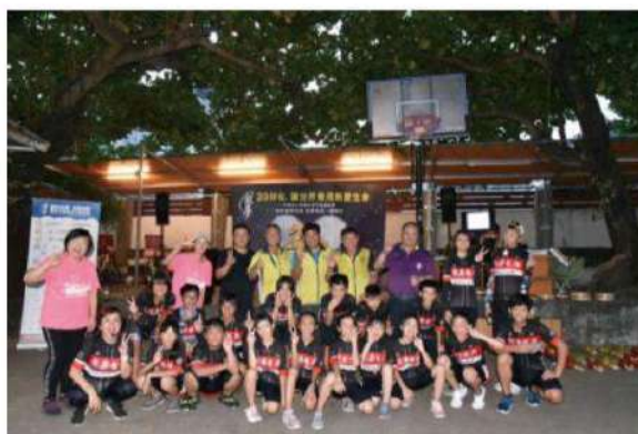
圖：二〇二〇「愛在台灣·希望無限」— 親善大使環台公益活動，日前來到台東，社團法人台東縣太麻里鄉曙光社區關懷協會做樂團交流與擔任公益播種的角色。

此外，今年更在環台過程中，不只有沿途做公益，更首次加入音樂會表演，因協會受邀與花蓮縣政府共同舉辦「四八高地草地音樂會」，在四八高地曼波園區演出，透過孩子們的演奏，吹散高地歷史坑道的煙硝，也向眺望花蓮七星潭的美景，送上大自然的歌頌。