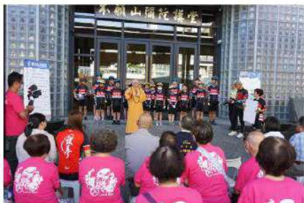
2020「愛在台灣·希望無限」——親善大使環台公益活動之啟航記者會。