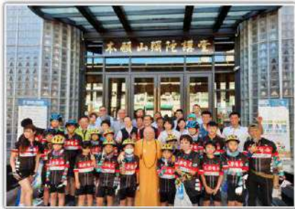
▲「愛在台灣·希望無限」——親善大使環台公益活動啟航。

社團法人中華國際幼障體成長協會與財團法人吳炳堂生命教育基金會共同主辦2020「愛在台灣·希望無限」——親善大使環台公益活動，今(12)日上午8點，在本願山體育館啟航。