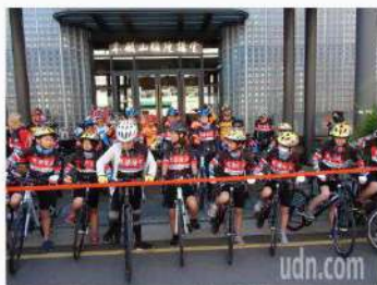
圖為大中華總商會與慈惠基金會聯合主辦的「愛在台灣·希望無限」2020親善大使環台公益活動，今天上午在本願山碼頭舉行啟航儀式。圖為大中華總商會與慈惠基金會聯合主辦的「愛在台灣·希望無限」2020親善大使環台公益活動，今天上午在本願山碼頭舉行啟航儀式。