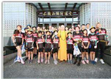
▲「愛在台灣·希望無限」——親善大使環台公益活動啟航。

此外，今年也在環台活動中，首次加入音樂表演，協會與高規格政府共同舉辦「國八開始早知音樂」，將於8月16日在國八開始早知音樂會，透過孩子們的表演，展現高規格高規格的精神，也向高規格高規格的高規格，這上天高規格的精神。