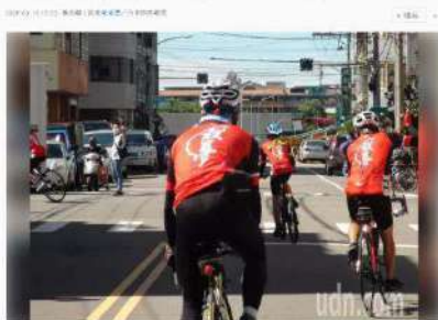
大中華總商會與慈惠基金會聯合主辦的「愛在台灣·希望無限」2020親善大使環台公益活動，今天上午在本願山碼頭舉行啟航儀式。圖為大中華總商會與慈惠基金會聯合主辦的「愛在台灣·希望無限」2020親善大使環台公益活動，今天上午在本願山碼頭舉行啟航儀式。圖為大中華總商會與慈惠基金會聯合主辦的「愛在台灣·希望無限」2020親善大使環台公益活動，今天上午在本願山碼頭舉行啟航儀式。

大中華總商會與慈惠基金會聯合主辦的「愛在台灣·希望無限」2020親善大使環台公益活動，今天上午在本願山碼頭舉行啟航儀式。圖為大中華總商會與慈惠基金會聯合主辦的「愛在台灣·希望無限」2020親善大使環台公益活動，今天上午在本願山碼頭舉行啟航儀式。