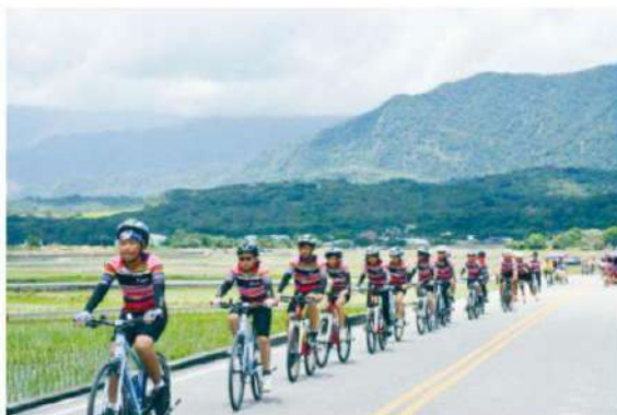
圖：社團法人中華民國婦幼關懷成長協會環島小騎士們，將來到花蓮與弱勢兒童交流才藝表演。

十六日下午四時在四八高地曼波園區舉辦的草地音樂會，縣府邀請復興國小「夢想起飛弦樂團」、銅蘭國小排笛團，與熱愛生命文教基金會「凡星樂團」共同演出，其中成員多是偏鄉及弱勢家庭的兒童與青少年。縣府將免費發送四百份三立冰淇淋，凡現場打卡即送，歡迎民眾屆時自由進場觀賞。