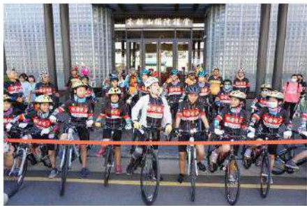
2020「愛在台灣·希望無限」——親善大使環台公益活動之啟航記者會。