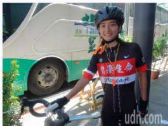
圖為大中華總商會與慈惠基金會聯合主辦的「愛在台灣·希望無限」2020親善大使環台公益活動，今天上午在本願山碼頭舉行啟航儀式。圖為大中華總商會與慈惠基金會聯合主辦的「愛在台灣·希望無限」2020親善大使環台公益活動，今天上午在本願山碼頭舉行啟航儀式。

此外，今年活動還將邀請多位知名人士擔任公益大使，為活動增添光彩。活動將於8月12日在本願山碼頭正式啟航。