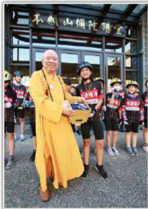
▲「愛在台灣·希望無限」——親善大使環台公益活動啟航。

康聖單位表示，我們已邁進銀髮八旬，光景倏忽轉瞬。今年格外再燃熱誠，策策支持踴躍！因為新即疾等不便及家人探康空位，策策經濟，幸電請的社社經體系資出推助。